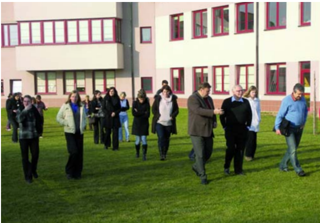
Exkurze na ZŠ Vrané nad Vltavou