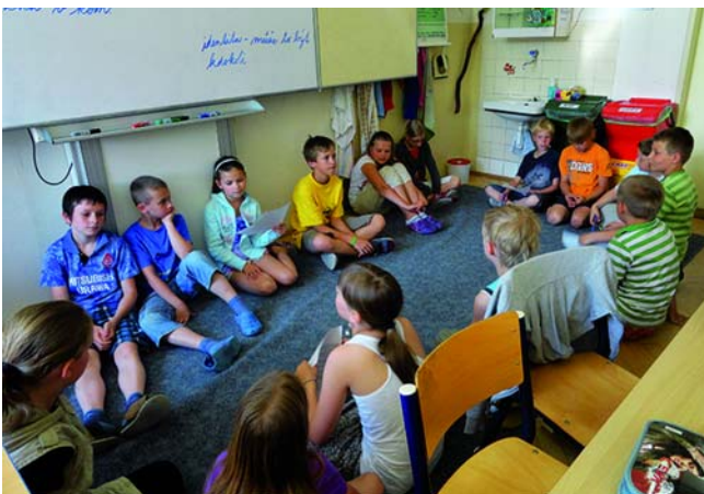
Výuka na ZŠ Poděbrady