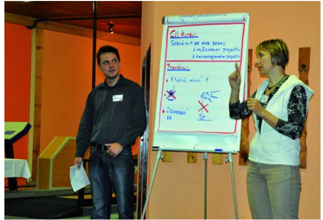
Zahájení projektu v Rakovníku