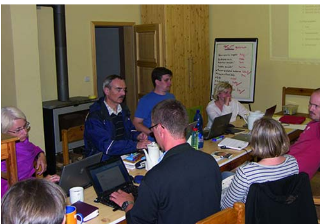
Porada interního týmu projektu ve Světicích