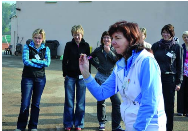
Učitelé partnerských škol projektu