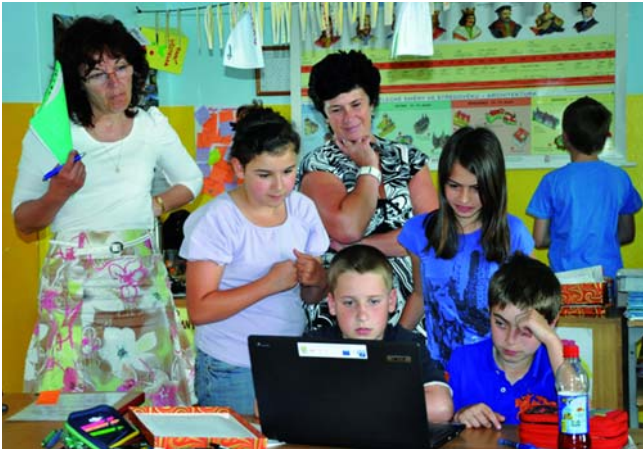
Výuka na ZŠ Lesní Liberec