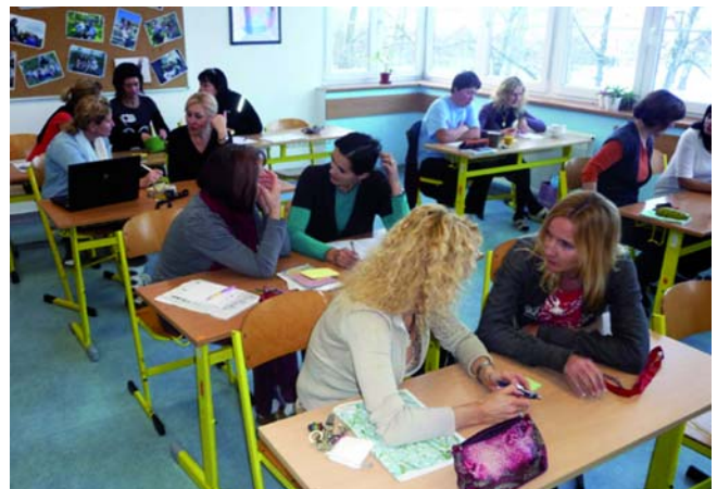
Kurz OSV na ZŠ Jesenice