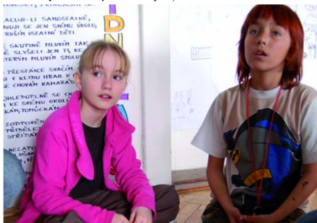
Exkurze na ZŠ Jesenice