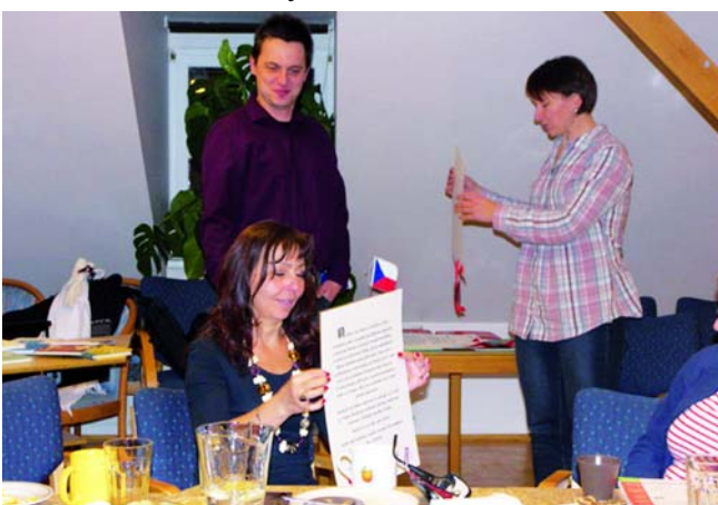
Předávání závěrečného certifikátu učitelům