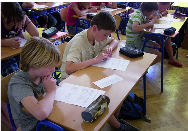
Projekt Kyberšikana na ZŠ Poděbrady