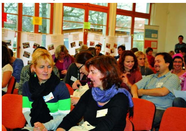
Účastníci závěrečné konference projektu