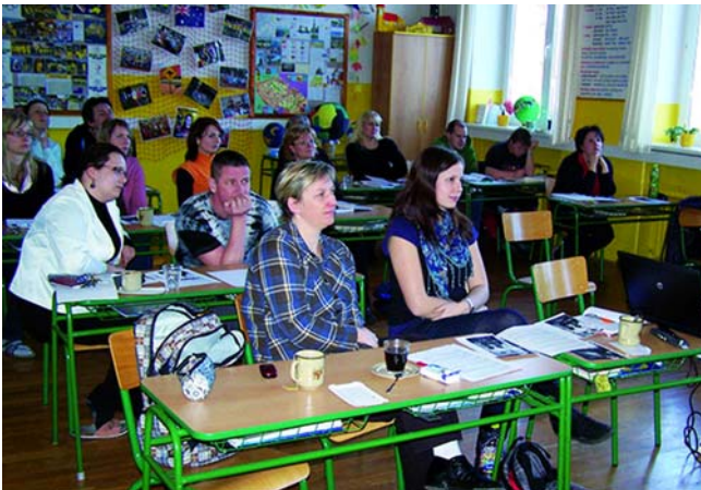
Kurz MV na ZŠ Smržovka