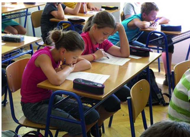
Projekt Kyberšikana na ZŠ Poděbrady