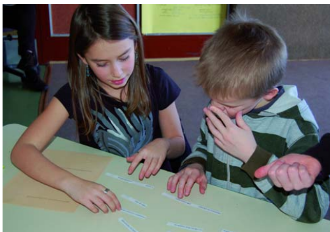
Exkurze na ZŠ Chrudim

Revize RVP a pojetí PT a čtenářství v něm nemusí ovšem vést v důsledku k tomu, že se průřezová témata nebo čtenářství stanou dominantními cíli vzdělávání. Současný vývoj a úroveň profesní připravenosti ve školách tomu nesvědčí. Existence průřezových témat, snaha o jejich včlenění do výuky a také důraz na čtenářskou gramotnost, čtení a čtenářství považujeme spíše za znak postupného přehodnocování vzdělávacích cílů vůbec, za krok na cestě ke kurikulu, které bude více respektovat komplexnost soudobého i budoucího života. Zároveň jsou PT i čtenářství výzvou pro profesní přípravu i rozvoj učitelů.