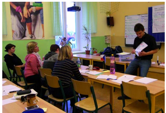
Kurz OSV na ZŠ Lesní Liberec